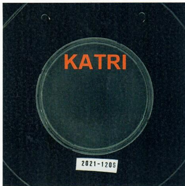
[ 시험편(After 5 min) / 시료1 ]